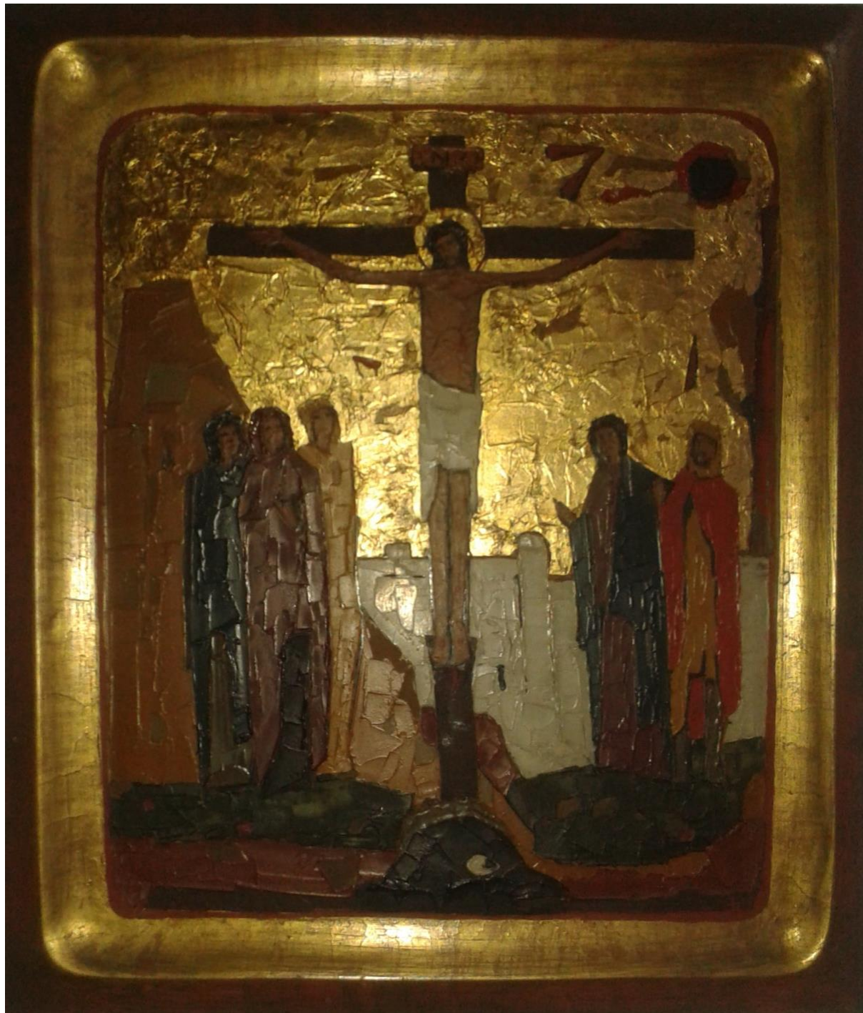
Kreuzwegstation, Kath. Kirche in Schöneiche

Es gibt keine größere Liebe, als wenn einer sein Leben hingibt für seine Freunde (Joh 15,13)